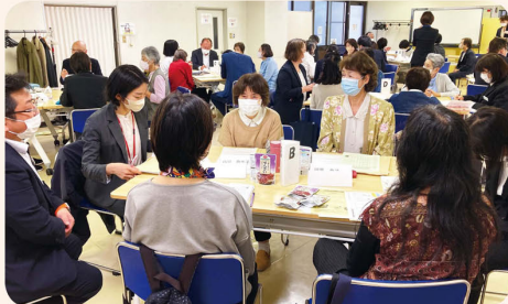
グループごとに活発に意見交換(大阪北地区第1選挙区)

つどいには各選挙区の総代と役員・職員が参加。まず2023年度上期のコープこうべの活動内容や業績などの報告がありました。その後はグループに分かれ、事業計画の「3つの柱」、「お買い物を通じた暮らしの安心づくり」「いきいきとした暮らし・地域のつながりづくり」「環境や社会のためになる活動・事業モデルの促進」の中から関心の高い事項について意見交換。11月8日にコレル桜塚(豊中市)で行われた大阪北地区第1選挙区のつどいでは「もっと地域のイベントに参加し、組合員以外の人にコープの魅力を伝えられるようにしたい」「朝食を食べない中高生への食育推進に協力してはどうか」など、さまざまな意見が出されました。