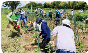
野菜づくりを一から学びます

土づくりや野菜づくりを体験し、有機農業について学びませんか。午前 は講義、午後は実習を 行います。収穫物はお 持ち帰りいただけます。 詳しくはお問い合わせ ください。