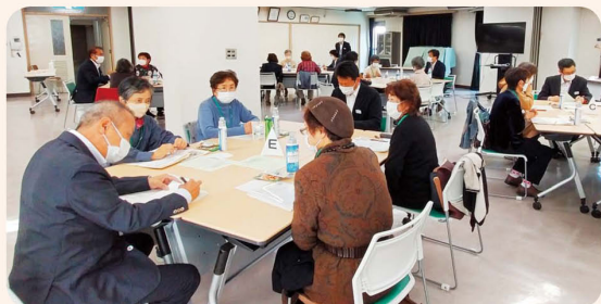
地域の身近な事例を挙げながら話し合い（第4地区第1選挙区）

つどいには各選挙区の総代と役員、職員が参加。2022年度上期のコープこうべの活動を映像で振り返り、業績などの報告がありました。その後、グループに分かれ「コープこうべの事業や活動に対して感じていること」「くらしや地域で起こっている変化や困りごとに対してどのようにしていきたいか」をテーマに意見交換。11月16日、コープ鈴蘭台東（神戸市北区）で行われた第4地区第1選挙区のつどいでは、「高齢者のゴミ出しや買い物への支援を」「つどい場や買い物行こカーを知らない高齢者がいるので、もっと周知が必要」などの意見が出されました。