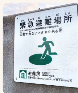
学校などは「避難場所」と「避難所」を兼ねる場合が多いようです