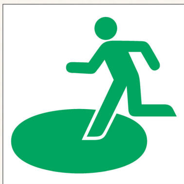
一時的に逃げ込む場所 (避難場所)