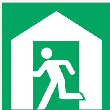
一定期間、避難生活を送る場所(避難所)

「避難場所」と「避難所」の違いをご存じですか？ 災害が起こったとき、命を守るために逃げ込む場所が「避難場所」。正式には「指定緊急避難場所」といい、洪水、土石流など災害の種類ごとに定められています。大きな公園や校庭などのほか、津波の危険性がある地域では高台や津波避難ビルが指定されています。