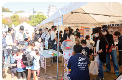
多くの来場者で にぎわうコープ こうべのブース

また、明石焼きやあなご料理などの飲食ブース、兵庫県や次回(北海道大会)の開催地である厚岸町の特産品の販売など45のブースが出演。コープこうべのブースには2日間で延べ1,800人以上が訪れ、「TEAM TOREPICHI」と一緒に「お魚の切り身クイズ」「タッチプール」などを楽しみました。