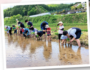
昔ながらの田植えに挑戦

「コープ親子で米づくり体験ツアー」は、田植え、生きもの調査、稲刈り、収穫祭の全4回を体験します。2022年第1回は6組15人の親子が参加しました。手植えはもちろん、機械植えも体験。JAたじまの職員から、但馬地域での米作りやつちかおりのこだわりについて聞きました。