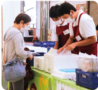
組合員にお渡しする商品を確認

今後、この取り組みをさらに広げ、福祉作業所との連携や障がい者の活躍の場づくりを進めていく予定です。