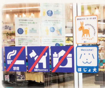
店舗の入り口にはさまざまなマークが。 ペットは入店禁止でも 補助犬は受け入れています