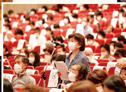
議案に対して総代が質問