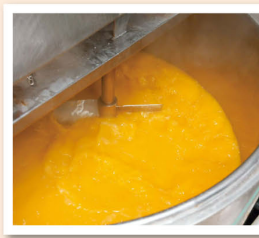
果汁は味を調節しながら70℃で10分間かくはん作業を行います