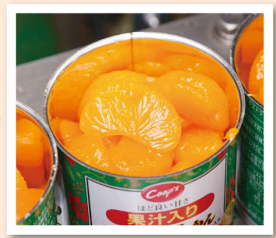
果汁を充填して商品になります