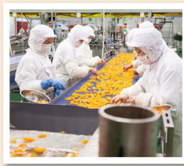
一房ずつに分けたみかんが流れてきます