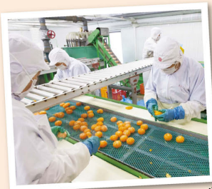
みかんを洗浄し、蒸して皮をむきます