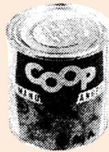
コープ商品第1号の みかん缶 1964年の商品(上) 1975年の商品(下)