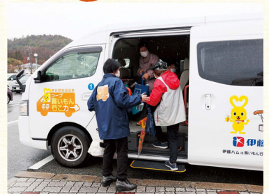
自宅から店舗まで無料で送迎する 「買いもん行こカー」