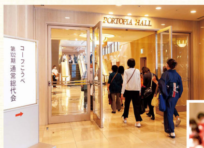
会場へ向かう総代の皆さん