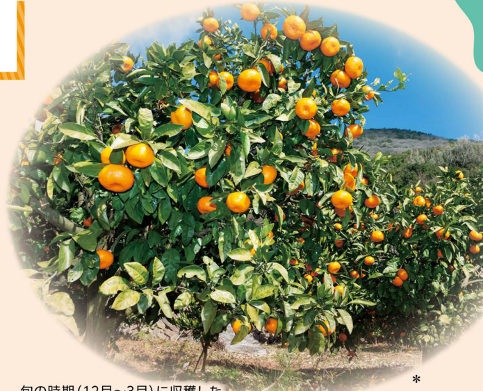
旬の時期(12月~3月)に収穫した 国内産みかんの果肉を使用しています

収穫されたみかんは洗浄後、蒸して外皮をむき、機械で一房ずつに分けてから薄皮を取り除きます。房が割れたものは取り除かれ、ジュースなど他の商品に使用。最後は人の目でも確認しながら充填しています。