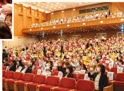
掲げられた議決票を数えて議案を採決