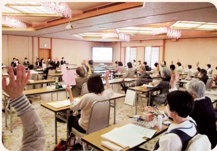
議決の様子 (第5地区)

また、2025年3月末に稼働終了することが決まった食品工場に関する意見や質問が事前に多く寄せられました。これらの声に対し「食品工場生産品が日本生協連との共同開発商品に変わっても、コープこうべの組合員の意見を商品の開発や改善につなげていくという考え方は変わらない」「今後も日本生協連と連携し、製造委託先としっかりコミュニケーションをとりながら、商品の安全性を確保していく」ということを説明しました。