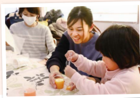
もうちょっと、オレンジ混ぜる？

ミックスキャロットの原料であるジュースを混ぜて、本物に近付ける企画に親子12組が挑戦しました。味見しつつ、スポイトで慎重に調合する子どもたちの姿は、実験中の博士さながら。オンラインの産地交流も行い、陽気な生産者が「83歳になっても、ニンジンで元気」とアピール。会場が笑いに包まれました。(行本)