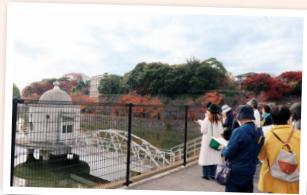
作品中で主人公たちの住む防空壕があった二テコ池

第2地区「平和を考える会」が、西宮を舞台とした作品「火垂るの墓」ゆかりの地や、市内の戦跡を巡るスタンプラリーを開催。「長く住んでも知らない戦跡があった」と家族で参加した人や、遠方からの参加者も。「ウクライナ情勢に思いをはせた」「平和の大切さを実感した」などの感想が聞かれました。(行本)