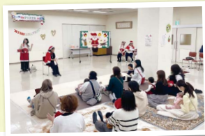
歌に合わせてリズム遊び

毎日がんばっているお母さんと子どもが楽しめるクリスマス会を塚口、宝塚で開催。宝塚で行われたのは、絵本サークル「ピコ」のコンサート。歌や絵本、ゲーム、親子でふれあい遊びなどをしました。サンタによるプレゼントタイムでは、子どもたちの喜ぶ様子が見られ、一足早いクリスマスを楽しんでいました。(高野)