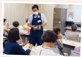
試食を通じて 意見交換も♪

くらしに役立つ知識を学ぶ「レインボースクール」。「フードプラン ほうれん草」の産地・養父市大屋町を視察した職員が、生産者の苦勞などを紹介。資料を見ながら大きくなずく参加者もあり、「商品を見るだけでは分からない、現地に行ってみて初めて分かることを伝えたい」という思いが伝わる時間となりました。(木下)