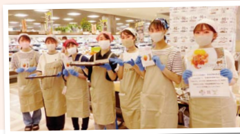
栄養学生団体 fun(ファン)の 皆さん

栄養士をめざす学生と兵庫県漁連が、「とれぴち」のイベントで試食会を実施。調理のしやすさと意外性を重視した「赤カレイのさっぱりトマトあん」はバジルが香る仕上がりに。「洋風でおしゃれ♪」「ホットプレートを使うのね」と調理の様子に興味深く見る人も。若い感性が感じられる一品に関心が寄せられました。(木下)