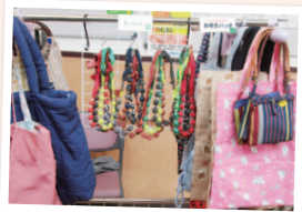
和布で作ったアクセサリやポーチ、バッグなど種類も豊富に

“コロナ禍”で集まることができなかった手仕事自慢のコープサークルが、久しぶりに一堂に会して手作り品バザーを開催。活動できなかった期間、自宅でコツコツと作りためた作品が並びました。桜塚エリアで活動中のコープサークルのパネル展示もあり、訪れた組合員も作り手も笑顔で交流していました。(和田)