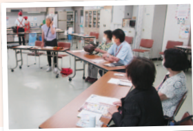
麺のおいしいゆで方なども教わりました

六甲アイランド食品工場で生産されていた納豆、こんにゃく、冷やし中華などの人気商品。これらの生産を引き継ぐメーカーは、組合員が慣れ親しんだ味に近づけるため、何十回も試作を重ねたと聞きました。実際に試食した参加者は「心配していたけれど、変わらずおいしくて良かった」と笑顔を見せていました。(和田)