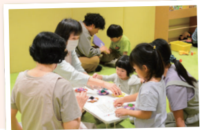
折り紙で作った コマに興味津々の 子どもたち

使わなくなった子ども服やベビー用品の循環を目的として活動している「おむすびの会」が「ぐるっとマーケット」を開催。お母さんたちが安心してイベントを楽しめるよう子育てサポーターが子どもを見守りました。不用になったものを必要としている人に譲る取り組みは、環境にも配慮されていてステキですね。(福永)