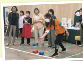
「ポッチャ」で盛り上がりました

“人と人をつなぐ集いの場”「大庄元気むら」の記念イベントに、利用しているサークルや地域から約150人が参加。全員での「いきいき100歳体操」の後、ワークショップやパラスポーツ「ポッチャ」のチーム対抗戦などバラエティーに富んだプログラムで楽しみました。皆さんの笑顔あふれるひとときでした。(高野)