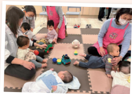
学習会中は 子育てサポーターが 赤ちゃんを見守り

コープの離乳食シリーズ「きらきらステップ」 の学習&試食会を開催。ごっくん期～モグモグ 期の親子7組が参加しました。試食したお母さ んからは「宅配で注文する！」「薄味だけど、大人 でもおいしい」といった声。とくに「やわらか いミニうどん」は、「塩分ゼロの商品を探してい た」「使いやすそう」と好評でした。(行本)