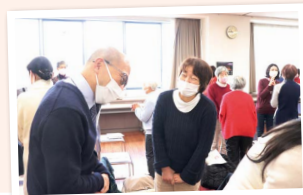
学んだ聴き方や話し方をその場で実践!

「コープくらしの助け合いの会」が公開講座を開催。話を「折らない、取らない、決めつけない」聴き手の基本や、話し手の心得を学びました。講義の項目ごとに参加者同士が会話をする実践編も。「生活や仕事に生かせそう」「高齢者の方との会話に役立てたい」など、抱負を語ってくれた参加者の笑顔が印象的でした。(行本)