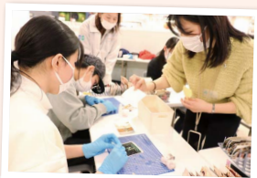
学生ボランティアの指導で写真洗浄

芦屋・西宮市内の高校生などが、被災支援ボランティア団体「おたがいさまプロジェクト」の指導を受け、自然災害で汚れた写真を洗浄。薬品で拭いた部分は白くなるため「大事な部分を消さないよう取捨選択が難しい」と悩む参加者も。被災者に思いをはせつつ、1枚ずつ泥や汚れを落としていました。(行本)