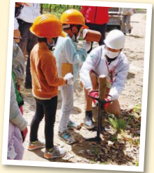
木の名札 「樹木板」を作ったよ