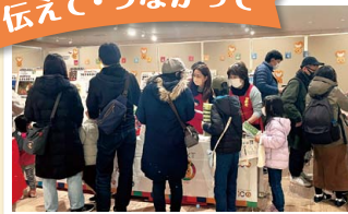
「すいた環境教育フェスタ」に参加

店頭や地域のイベントなどで商品の良さやコープの取り組みを伝えます。地域の人との交流も