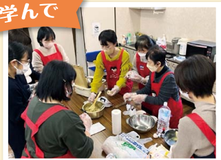
時短料理の教え合い

自分たちで商品学習やくらしの講座、施設見学などを企画し、楽しく学びます。子連れでの活動もOK